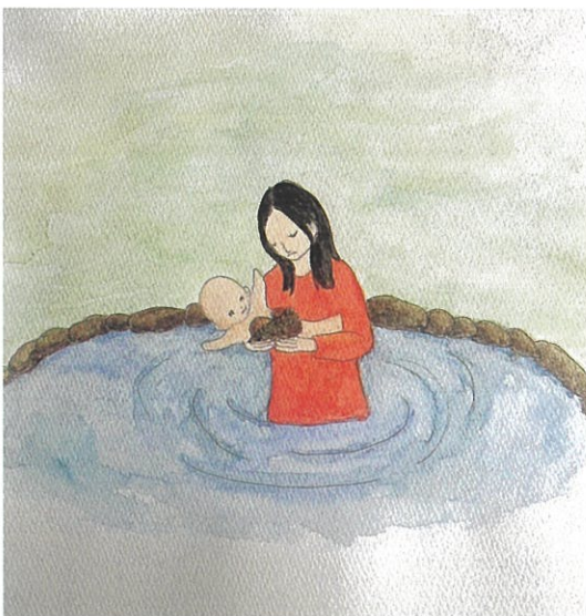
羅睺羅を助け出した耶輸陀羅妃