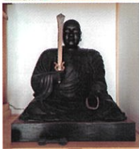
▲利剣大師(弘法大師)