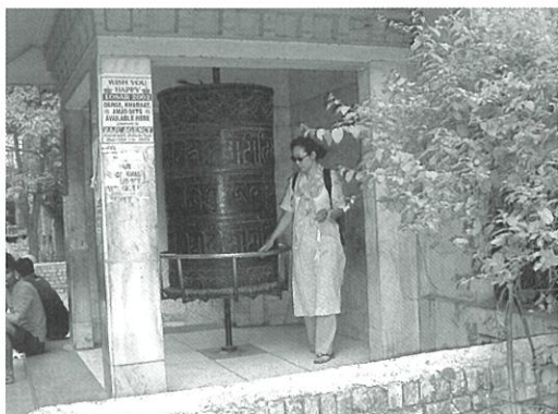
ラダック寺のマニ車

どたどしい英語で尋ねると、露店のおじさんも、なまりのあるたどたどしい英語で説明してくれるのだが、話は半分も理解できない。そんなやり取りにお構いなく利子は、タンドリーチキンを漬け込む為の、ヨーグルトに混ぜるミックス・スパイスを一〇〇グラム注文するよう僕に言うのだ。おじさんは手際よく何種類かのスパイスを秤に載せて混ぜてくれた。ついでにチリ・ペッパーも一〇〇グラム頼み、前者は五〇ルピー(約一二五円)、後者が三〇ルピー(約七五円)だった。