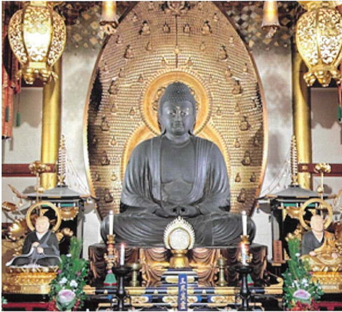
総本山誓願寺ご本尊 阿弥陀如来坐像