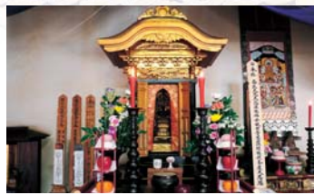
准胝仏母観世音菩薩

【交通】 名鉄美合駅より車で5分 【主な行事】 初観音法要 1月18日 春彼岸法要 春分の日 施餓鬼法要 7月18日 盂蘭盆供養 8月13~16日 秋彼岸法要 秋分の日 【お問い合わせ】 胎蔵寺 〒444-0004 愛知県岡崎市保母町稻荷下5-2 (0564) 47-3172