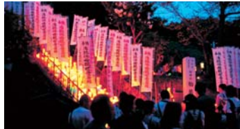
境内入口階段のキャンドル群