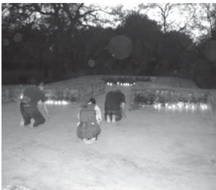
シユラヴァステイ 祇園精舎内の僧院跡にて

宿泊の手続きをし、例のお坊さんと厨房の係の男性が食事の用意をしてくれた。質素な夕食の割には量はたっぷりであり、日本語も少し話せるそのお坊さんが横に付いて、話をしながらお代わりを勧めてくれた。このお寺に居るお坊さんは二人だけで、シリランカから来ていて、小柄で物静かで実直な感じの彼と大僧正、先ほどの賑やかな女性の団体は、自国から仏跡参拝に来ているとのことだった。