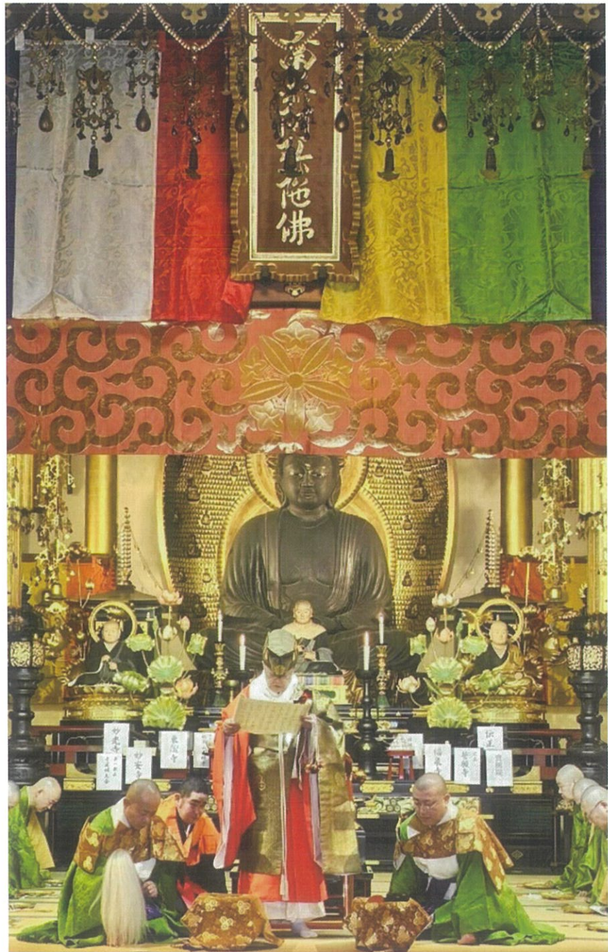
◆ 令和六年度西山忌法要 鎮勧用心拝読 ◆