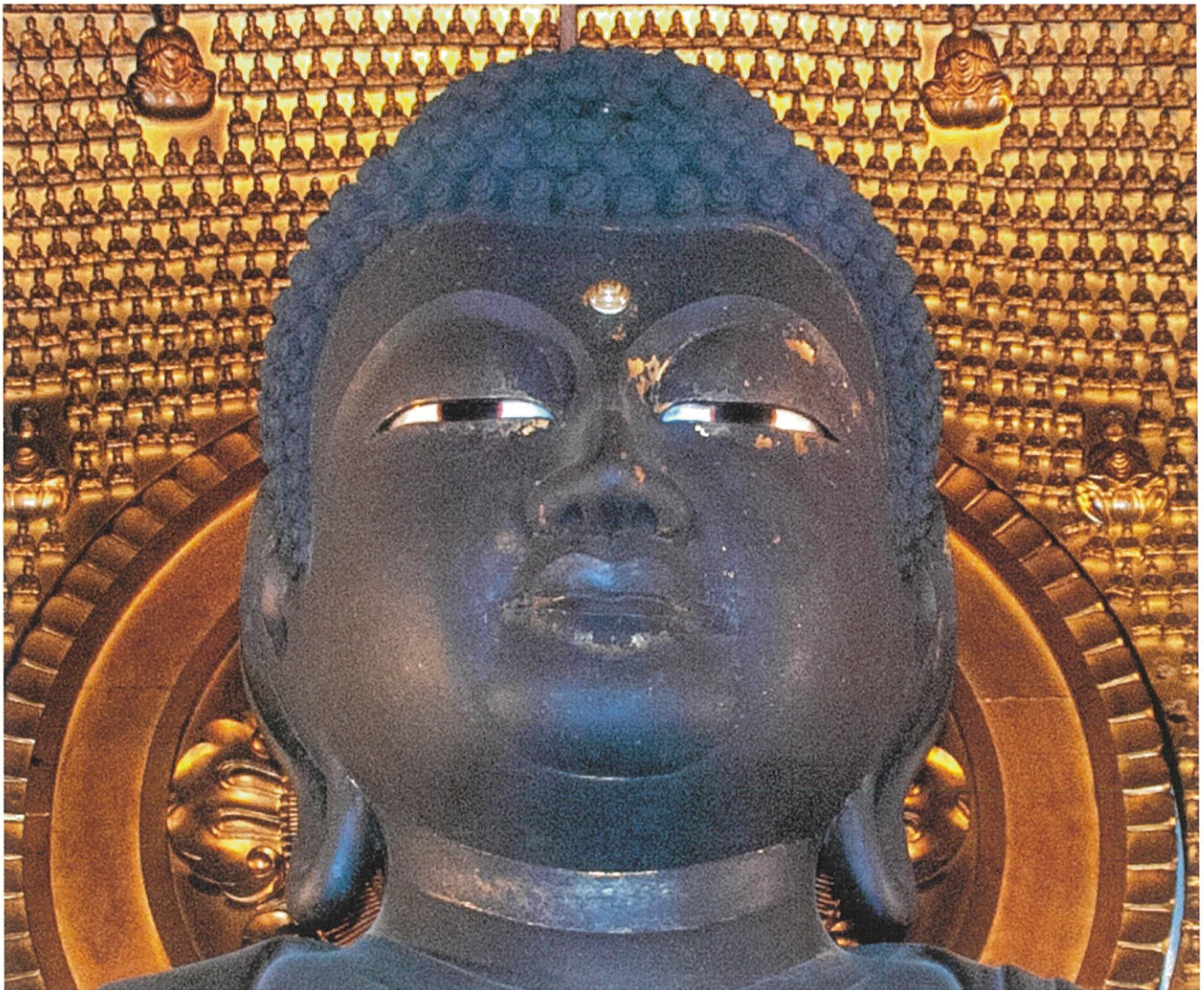
◆ 総本山誓願寺 御本尊 木造阿弥陀如来 ◆