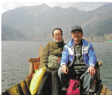
ナイニタールの湖にて

に乗らないかと客引きが寄って きて、せっかく湖畔で泊まった のだからと、三〇分で五〇ル ピーのところを四〇ルピー（約 一〇〇円）に値切り乗せても らった。湖面を吹く風は少しヒ ンヤリしていて、厚着をしてお いて正解だった。湖水は生活排 水が混ざるためだろう、お世辞 にもきれいとは言えない。季節 外れの避暑地はこんなものかと 思いつつボートを降り、もう一 度カジュラホーに電話を入れた ら、リコンファームは大丈夫と の返事だったので、僕たちは安 心してバスを待つことができ た。