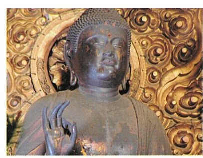
▲平成26年愛知県指定文化財『阿弥陀如来坐像』